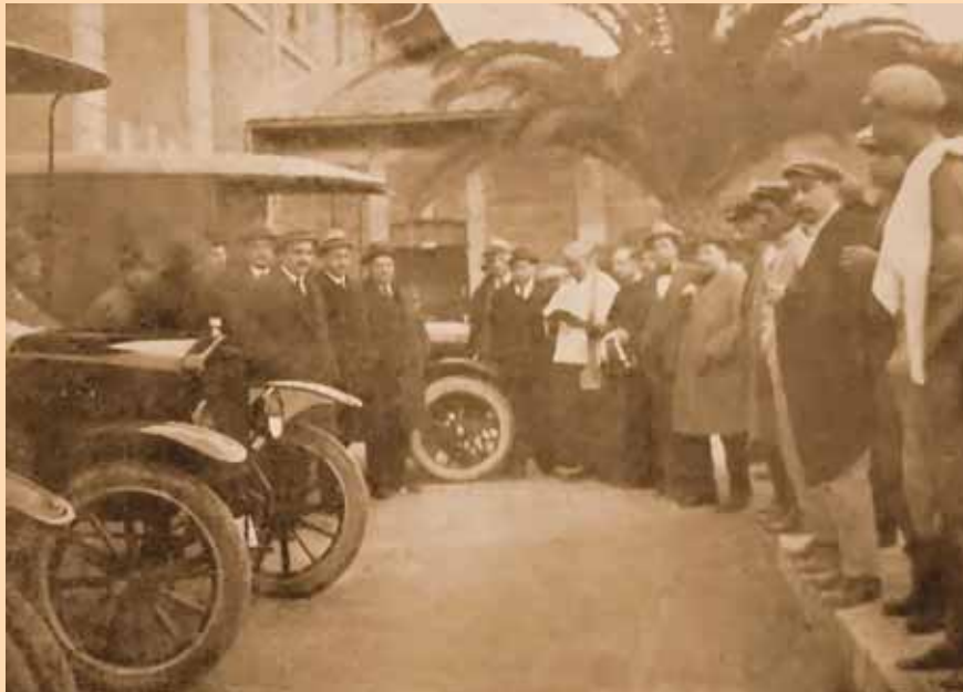
Camiones Automoviles Transporte Carne (15.12.1922).

Es también conveniente destacar, que la población consumidora no comprendió la importancia del control sanitario de los alimentos, hasta bien avanzado el siglo XIX.