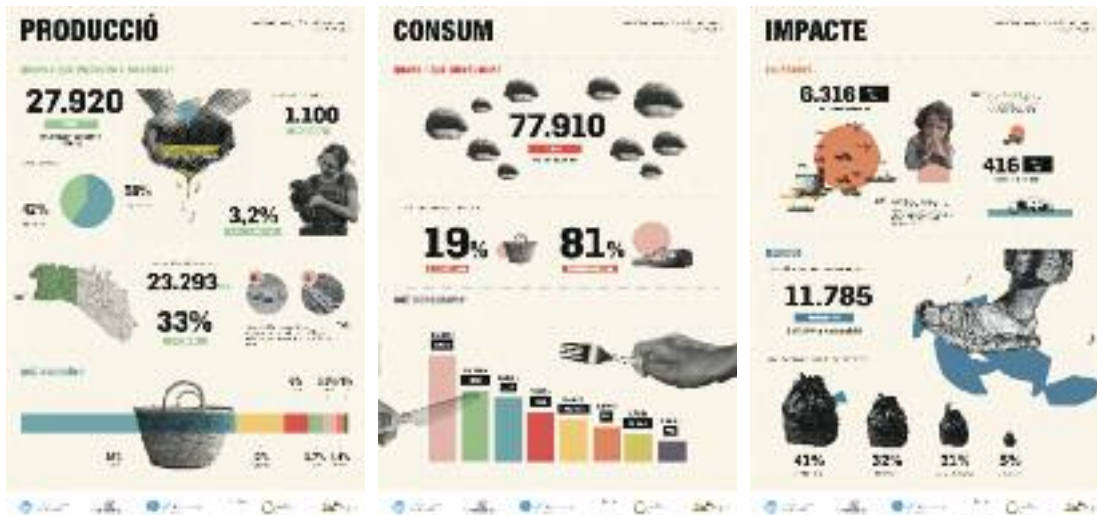
Infografies realitzades pel Consell Insular de Menorca.

Aquesta és la pregunta que han respost els estudis realitzats pel Consell Insular de Menorca sobre els fluxos alimentaris de l'illa i la demanda pública d'aliments que ha coordinat Justícia Alimentària. Aquests estudis formen part de les accions de l'Estratègia Alimentària 2018-2021.